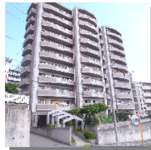
フォレストコート西条 1004号室